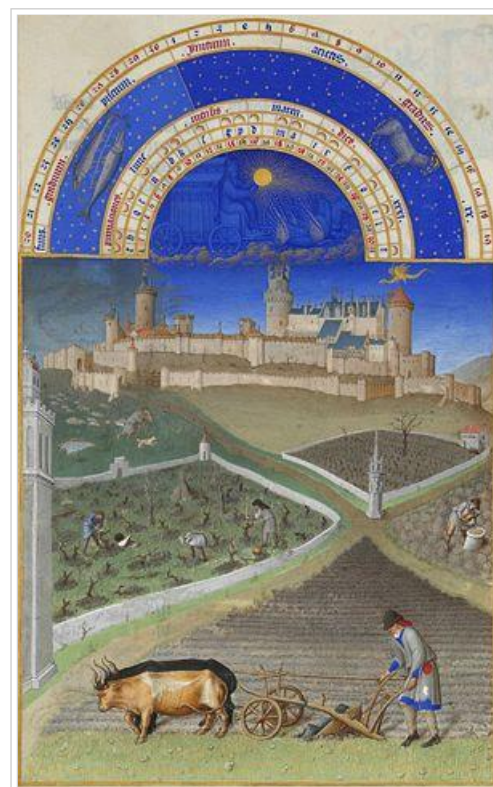
Les Très Riches Heures du duc de Berry , March: the Château de Lusignan

Categories: Former castles, palaces, and fortresses | Châteaux in France | Vienne | Official historical monuments of France